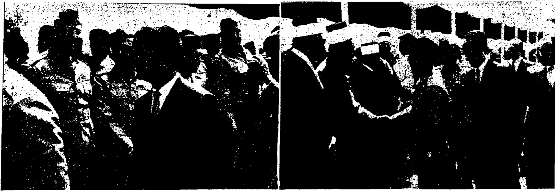
جلالة الملك العظيم يصالح رجال الدين في العراق خلال زيارته لبيروت. وفي الصورة الثانية سمو الامير حسني بن الحسين المقيم في القاهرة يصالح كبار ضباط الجيش العراقي